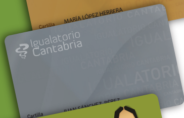
PÓLIZA PLATA PLUS