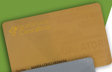
PÓLIZA ORO PLUS